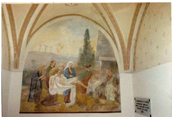
Affresco della deposizione verso il 1990