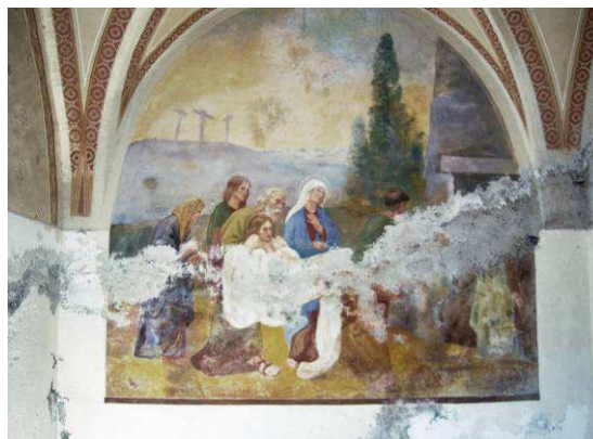
Stesso affresco alla primavera 2012

della cappella del Santo Sepolcro a San Martino per bloccare le infiltrazioni di umidità che hanno deturpato gravemente l'affresco e la decorazione interna.